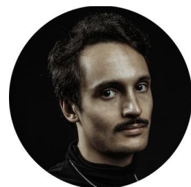
REMY Batterie, chœurs & technique